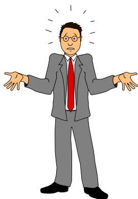
Hvad gør jeg nu?

tilbage til videoen, som toner frem på skærmen.