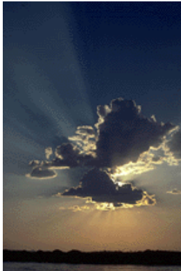
En mørk sky kom

afgive en mand i krigstjeneste for hver 20. tønde hartkorn, på den måde blev Jeppe soldat.